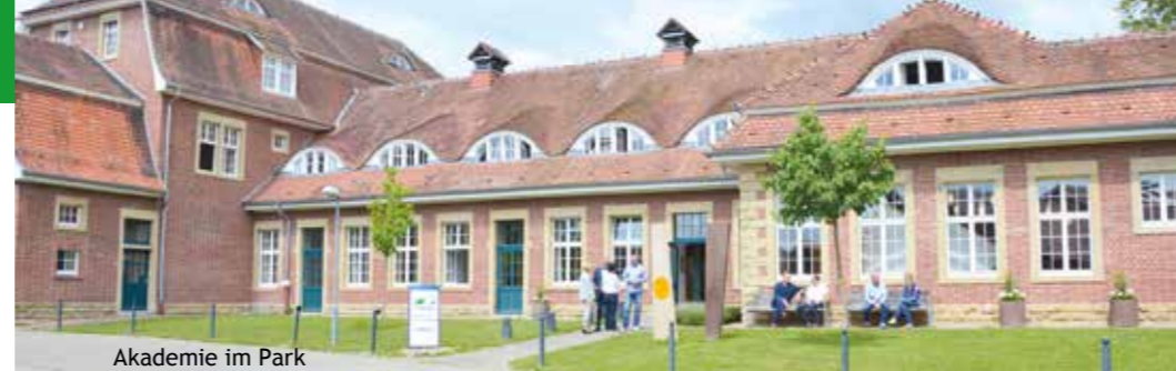
Akademie im Park

Das Psychiatrische Zentrum Nordbaden beschäftigt eine Vielzahl verschiedener Berufsgruppen. Unsere Mitarbeiter_innen sind einerseits für das Wohlergehen der Patient_innen und andererseits für das reibungslose Funktionieren der Krankenhausorganisation zuständig. Von den insgesamt 1700 Beschäftigten arbeiten rund 75 Prozent im therapeutischen bzw. pflegerischen Bereich.