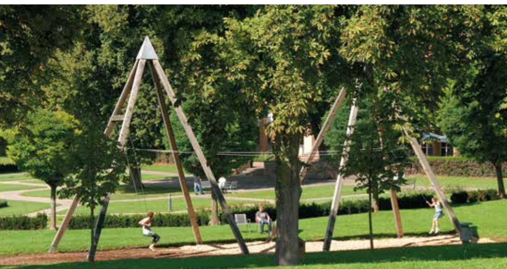
Partnerschaukel im Sinnespark