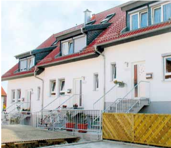
Wohnverbund Südliche Zufahrt

In diesem Bereich leben chronisch psychisch kranke Menschen, die einer längerfristigen Rehabilitation bedürfen. Ziel ist es, zusammen mit den Betroffenen eine realistische Lebensperspektive zu erarbeiten und sie auf ein Leben in weniger intensiv betreuten Wohnstrukturen vorzubereiten.