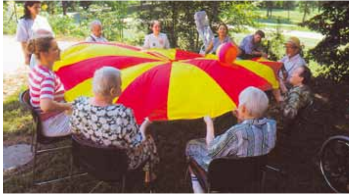
Bewohner des Hauses Sanssouci bei der Seniorengymnastik

In diesem Bereich leben chronisch psychisch kranke Menschen, die teilweise intensiv pflegebedürftig sind und einen hohen Grad an Immobilität aufweisen. Hier geht es im Schwerpunkt um qualifizierte Pflege zur Reduktion krankheitsbedingter Defizite und den Erhalt von Alltagsroutine, sozialer Kompetenz und Lebensqualität.