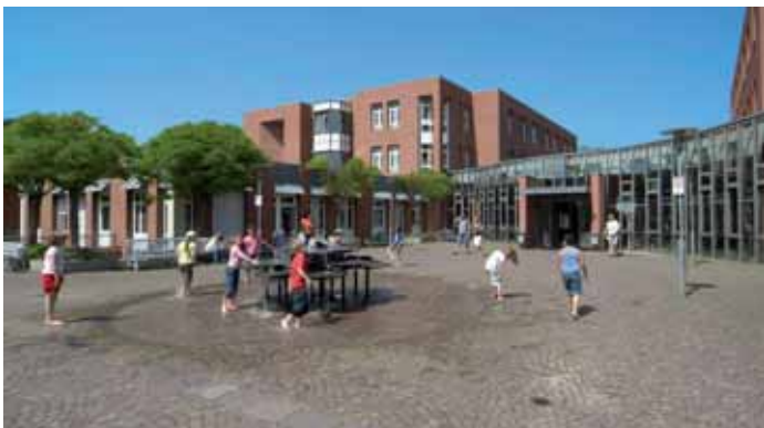
Haupteingang des Zentralgebäudes