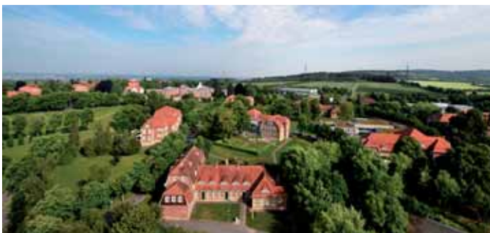
Blick über das Zentrum mit dem Park

Das PZN wurde im Jahr 2005 erstmals nach KTQ zertifiziert und 2008 rezertifiziert. Eine KTQ-Zertifizierung ist freiwillig und zeigt unser Engagement für eine qualitativ hochwertige Behandlung. Darüber hinaus ist die Klinik für Suchttherapie und Entwöhnung nach deQus zertifiziert, dem suchtspezifischen Qualitätsmanagement. Im PZN wurde erstmals in Deutschland das deQus-System auf die gesamte Abteilung eines psychiatrischen Fachkrankenhauses übertragen.