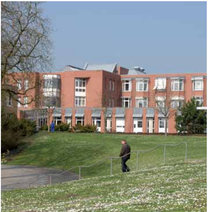
Zentralgebäude des PZN

Alle neuen Mitarbeiter erwartet im PZN eine gute Einarbeitung, kompetente Anleitung und persönliche Betreuung. Wir freuen uns auf Sie.